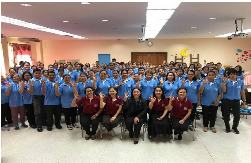
ทีมหมอครอบครัวอำเภอคอนสวรรค์