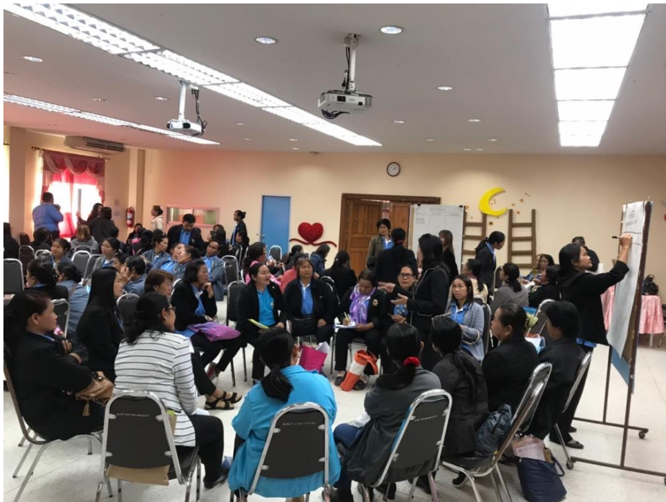
แลกเปลี่ยนเรียนรู้และการจัดทำแผนการคัดกรองในแต่ละตำบล