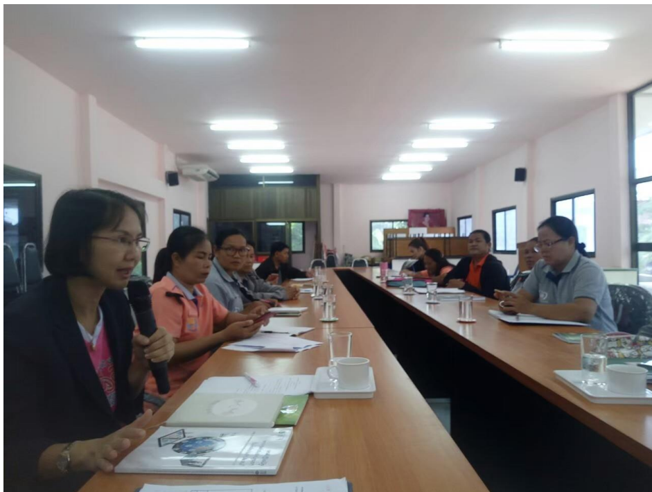
ประชุมวางแผนการออกคัดกรองแต่ละตำบล