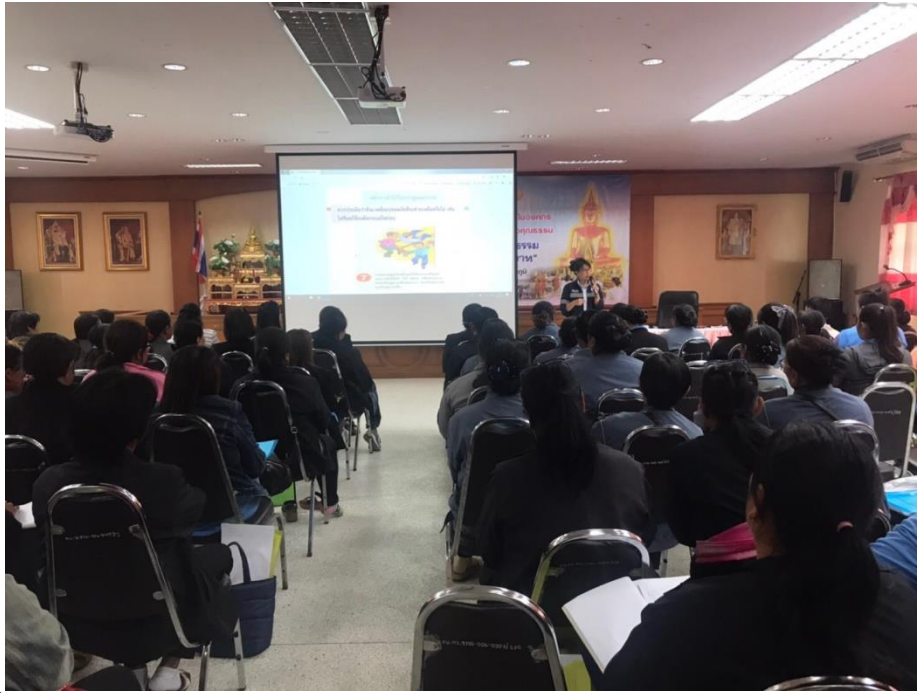
ประชุมชี้แจงแนวทางและจัดทำแผนการคัดกรองสุขภาพผู้สูงอายุสำหรับทีมหมอครอบครัวระดับตำบล