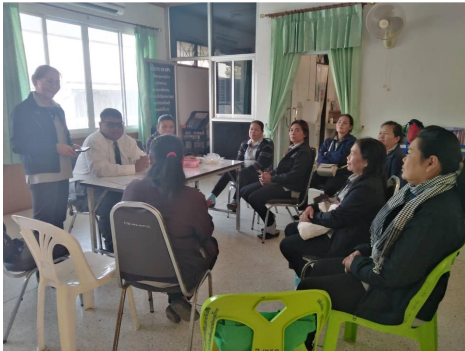
ประชุมวางแผนการออกคัดกรองแต่ละตำบล