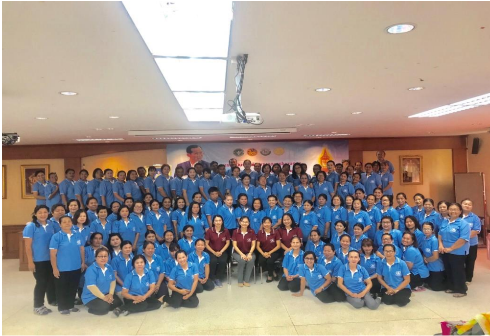
ทีมหมอกรอบครัวแต่ละตำบล