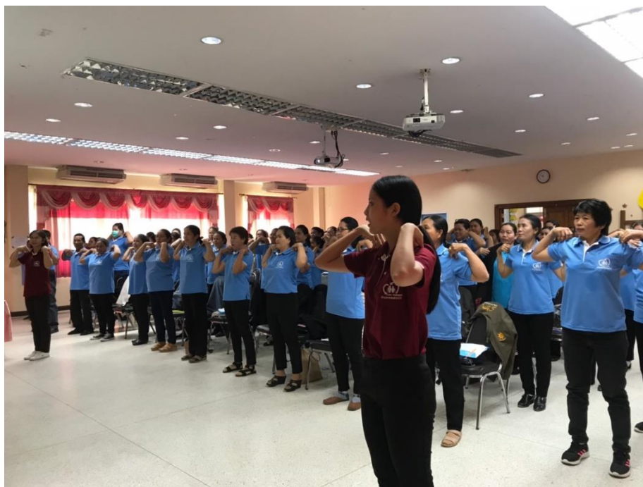
ทีมหมอกรอบครัวอำเภอคอนสวรรค์