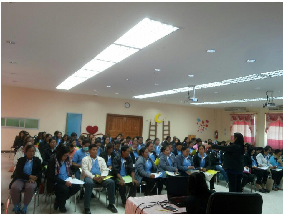
ประชุมชี้แจงแนวทางและจัดทำแผนการคัดกรองสุขภาพผู้สูงอายุสำหรับทีมหมอครอบครัวระดับตำบล