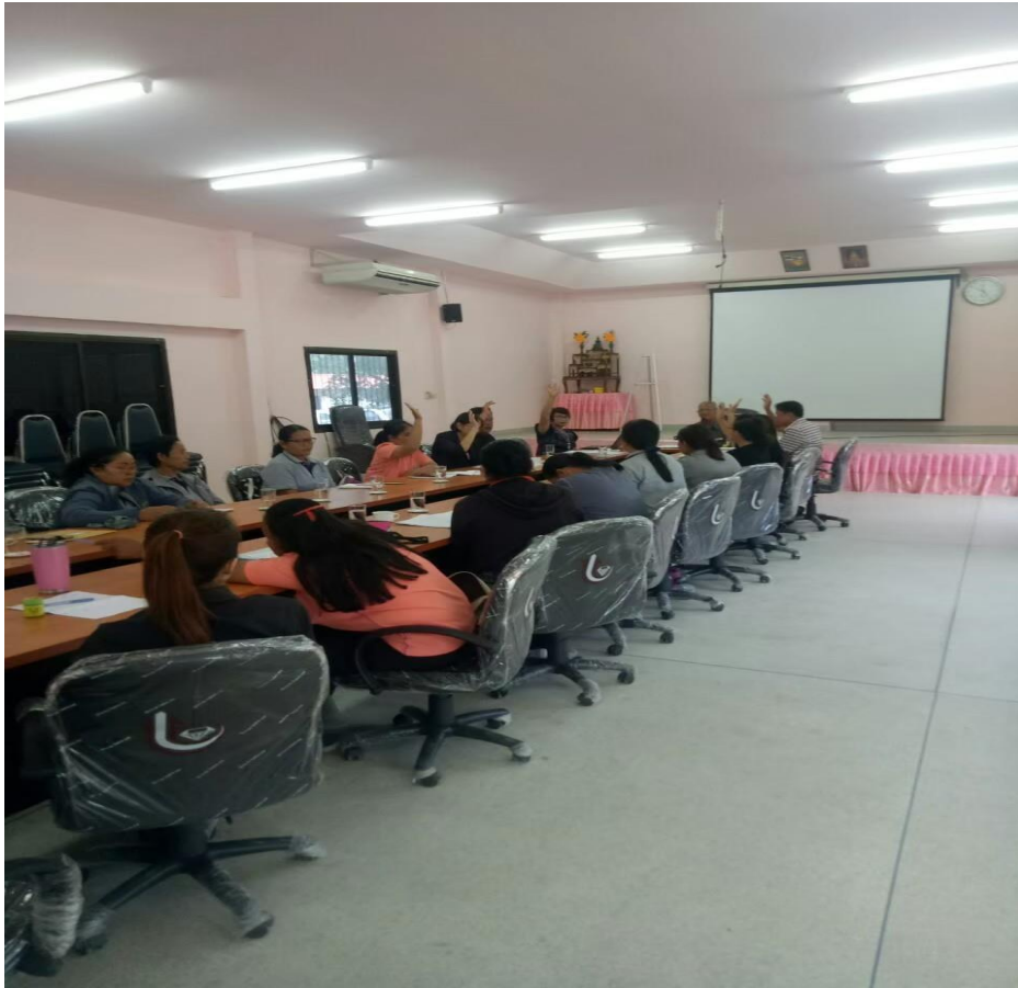
ประชุมวางแผนการออกคัดกรองแต่ละตำบล